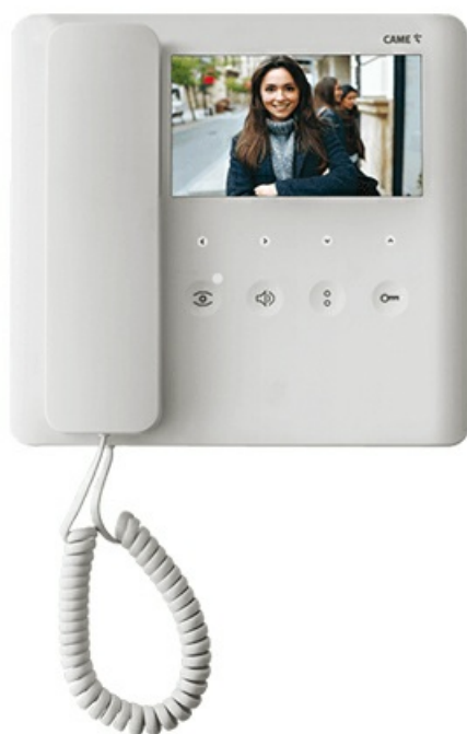
Фото Комплект видеодомофона AGT для системы X1 с вызывной панелью МТМ САМЕ 8K40CF-020

Отправьте запрос на коммерческое предложение и получите индивидуальные цены и сроки поставки