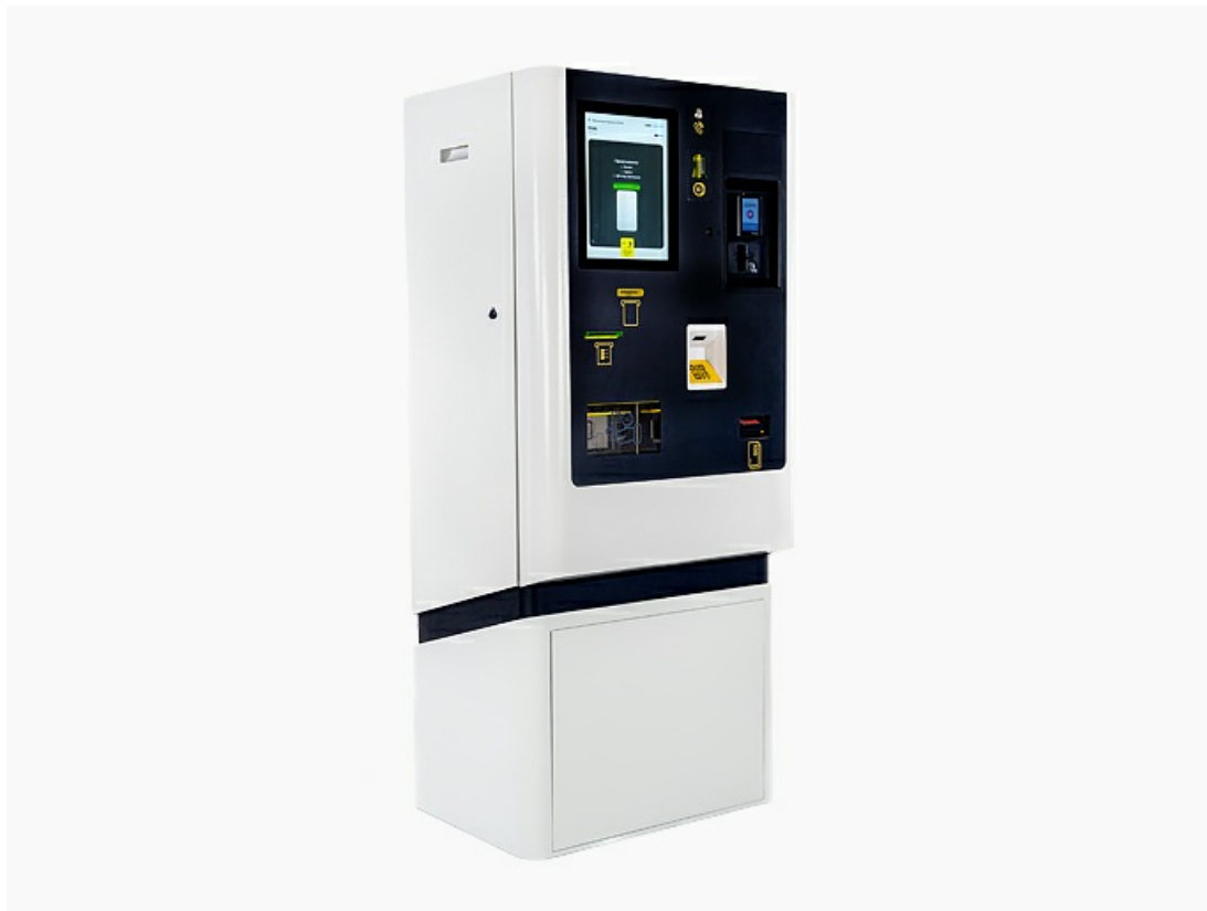
Фото Автоматический терминал оплаты CVB-P CAME CVB-P012021010

Тел: +7 499 681-75-28 | Email: sale@came-russia.ru | https://came-russia.ru