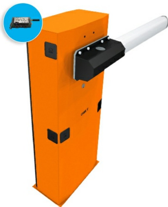
Фото Комплект шлагбаума GARD 6500 с управлением через приложение CAME G6500 GSM Connect

Отправьте запрос на коммерческое предложение и получите индивидуальные цены и сроки поставки