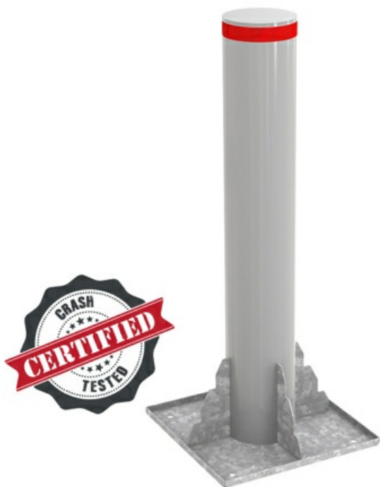
Фото Блокиратор стационарный серии HBD, диаметр 275, высота 1000 мм. SRF K12 CAME HBD-275S100-SRF12

Отправьте запрос на коммерческое предложение и получите индивидуальные цены и сроки поставки