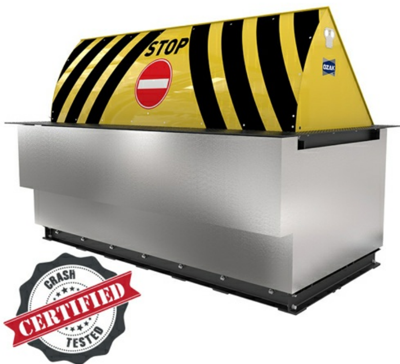
Фото Блокиратор дорожный HRB 900 серии HRB Anti-terror Heavy Duty K12 CAME HRB-30R90

Отправьте запрос на коммерческое предложение и получите индивидуальные цены и сроки поставки