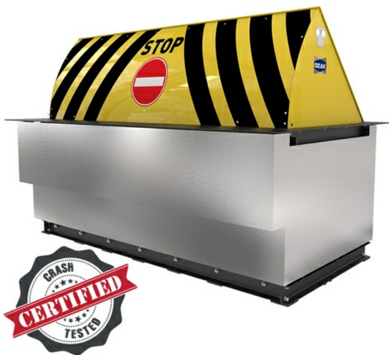
Фото Блокиратор дорожный серии HRB Anti-terror Heavy Duty K12 CAME HRB-20R60

Отправьте запрос на коммерческое предложение и получите индивидуальные цены и сроки поставки