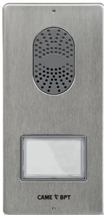
Фото Вызывная видеопанель LITHOS с 1 кнопкой, фронтальная панель из сатинированной стали, цвет серый CAME LKITVX1-1

Отправьте запрос на коммерческое предложение и получите индивидуальные цены и сроки поставки