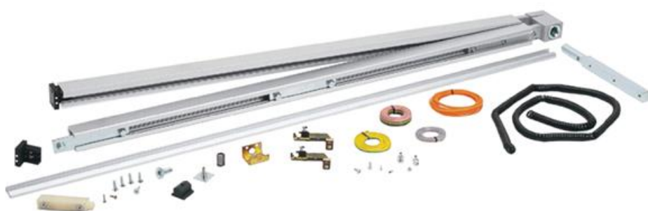
Фото Комплект "Антипаника" для одностворчатой раздвижной двери с шириной створки до 1500 мм CAME 818XC-0019

Отправьте запрос на коммерческое предложение и получите индивидуальные цены и сроки поставки