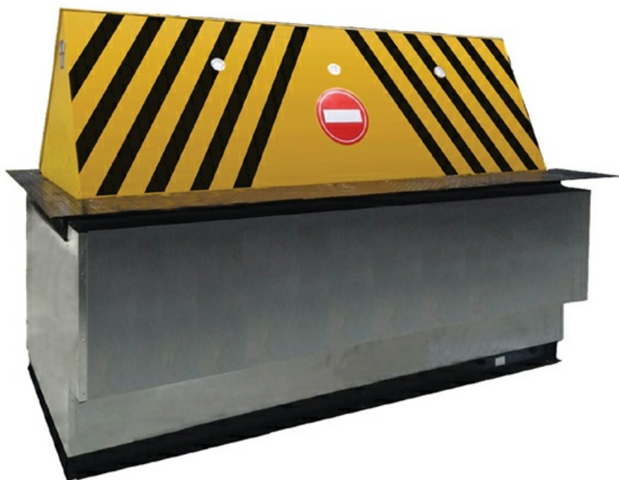
Фото Блокиратор дорожный серии RB с двумя гидроцилиндрами, длина 5000, высота 600 мм CAME RB-50F60-2p

Отправьте запрос на коммерческое предложение и получите индивидуальные цены и сроки поставки