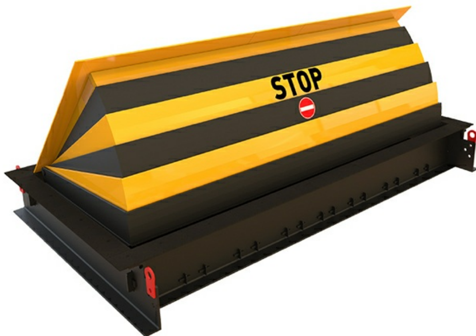
Фото Блокиратор дорожный RRB 900 SHALLOW CAME RRB-55P90-2p-SHLW

Отправьте запрос на коммерческое предложение и получите индивидуальные цены и сроки поставки