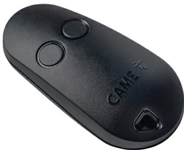
Фото Набор брелоков-передатчиков TOP Sport Line 30 шт. 2-х канальный CAME 806TS-0300/30

Отправьте запрос на коммерческое предложение и получите индивидуальные цены и сроки поставки